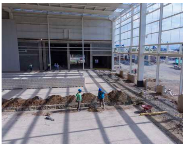
Pisos y Pavex Premium